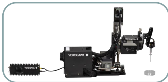
超低侵襲スマートインジェクター SU10